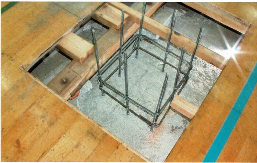
型枠を一旦外して鉄筋合わせ