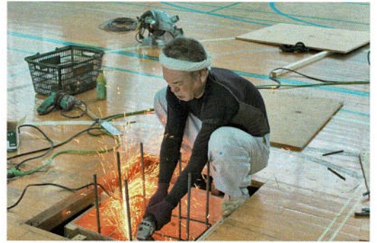
鉄筋の切断で大きくあがる火柱