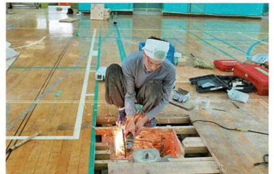
鉄筋を切断して高さを調節