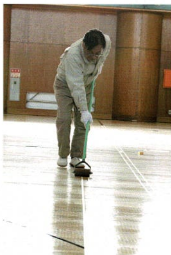
マスキングテープ貼り