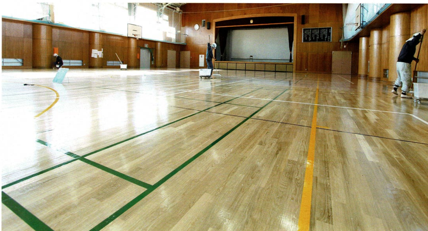
ライン完工。クリアコーティングをさらに施します