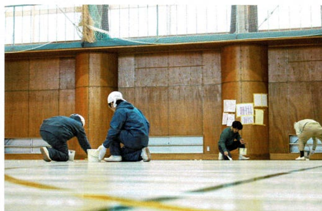
競技種目ごとにマルチラインを引く