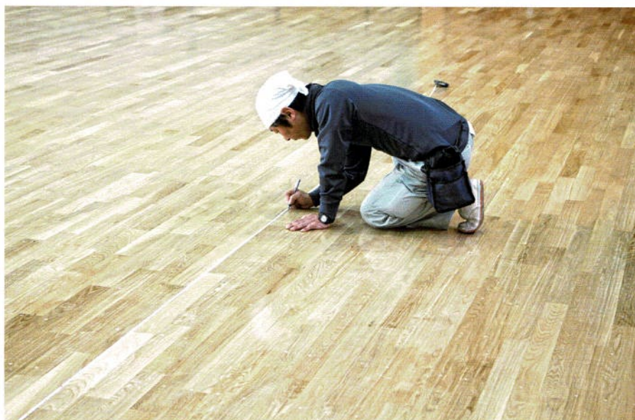
緊張のコートライン引き用のセンター決め