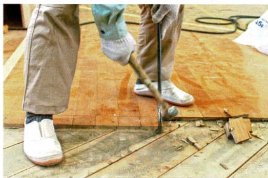
保存箇所を乱尺に切り欠き落とし