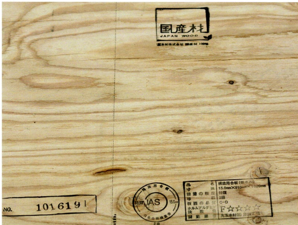
新規に張る床材下の構造用合板 (15mm厚 国産 低ホルム/F☆☆☆☆)