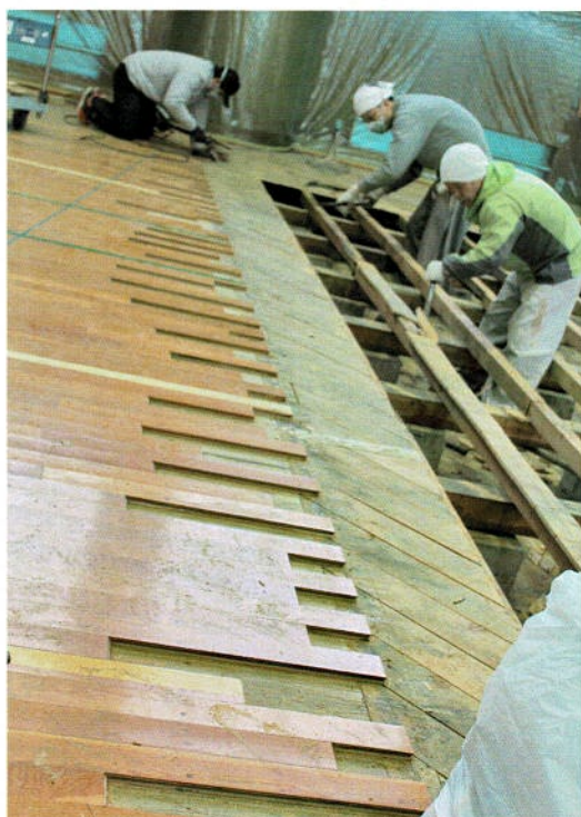
既存フロア材との接合部