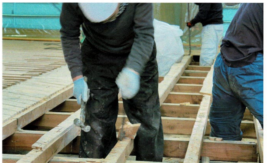
捨て張り板材の撤去