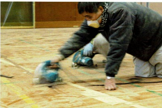
フロア床材の剥離に着手