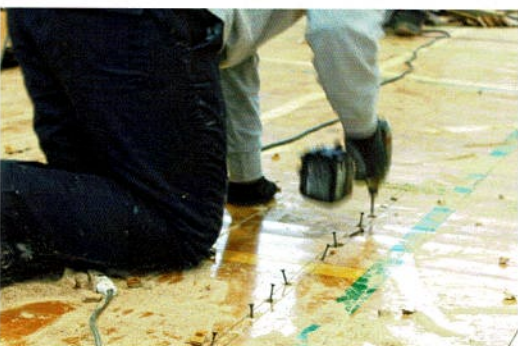
床材取り付けボルトは1本ずつ除去