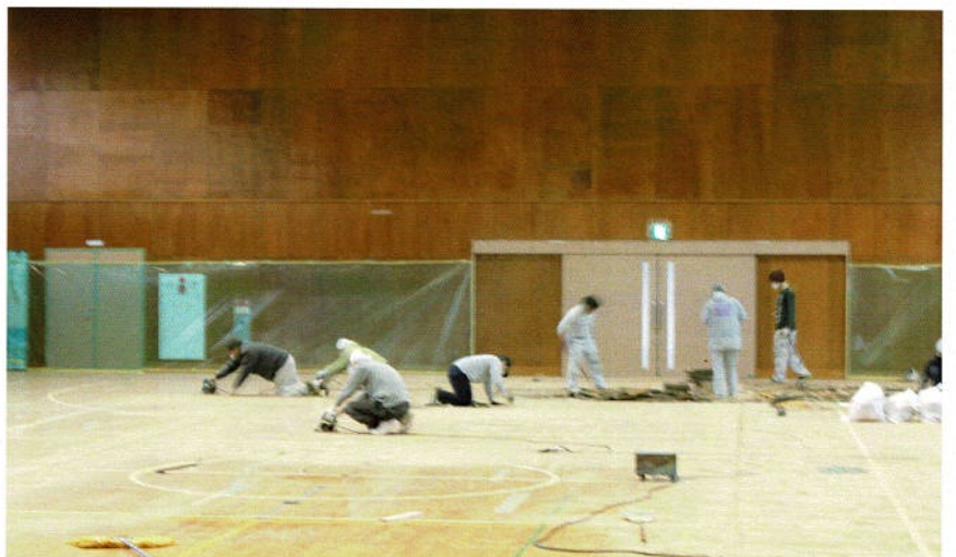
総掛かりの作業になります