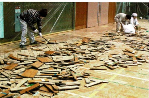
丁寧に剥離を進めます