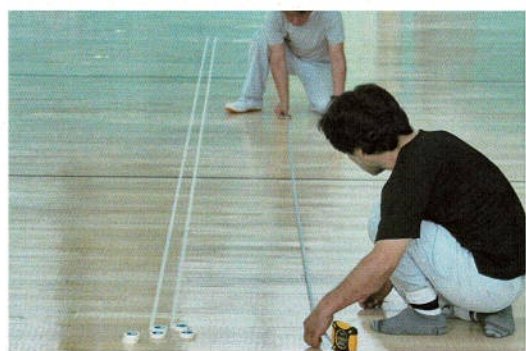
丁寧なマスキングで下準備