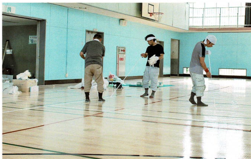
最後にマスキングテープを剥がしてライン引き完了