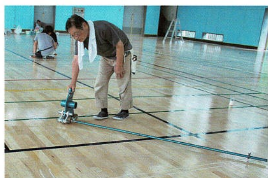
精密な測図でサークルもマスキング