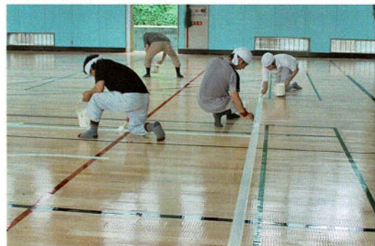
油性塗料でライン引き