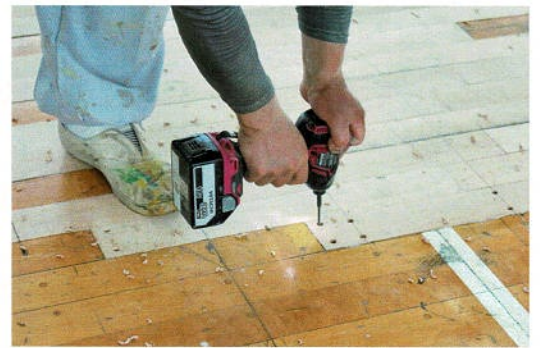
木ビスの打ち込み