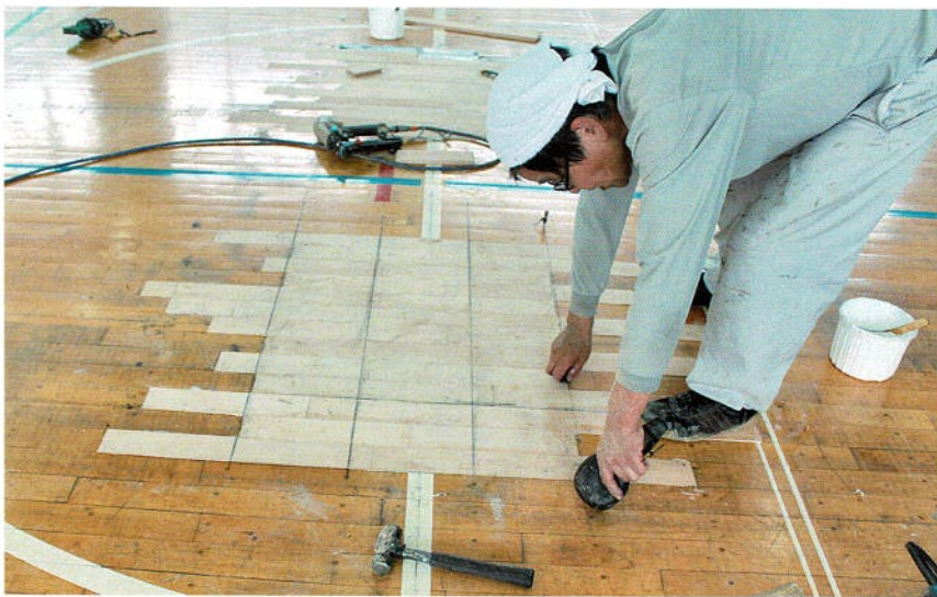
貼り込み後、根太合わせの墨つけ