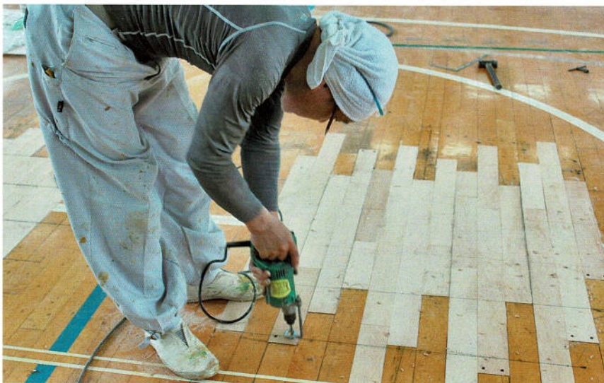
ラインに合わせてぶビス穴開け