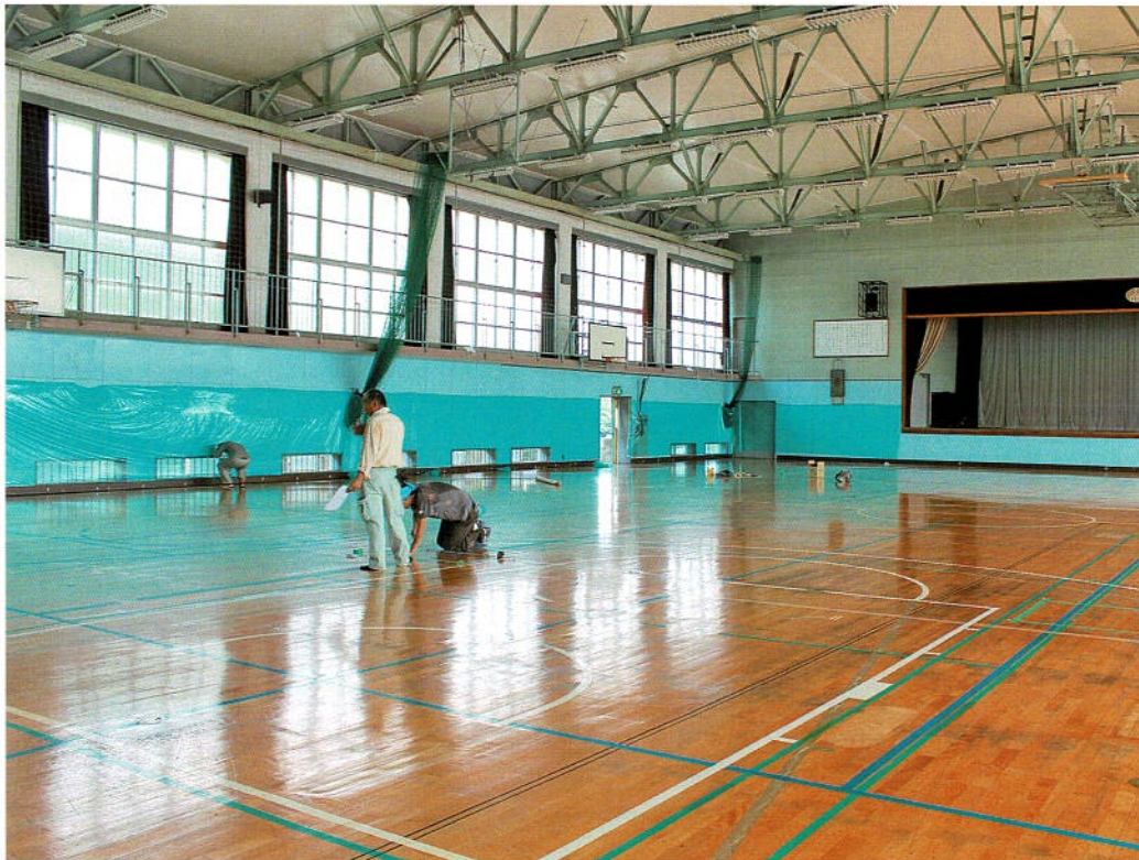
補修前点検で修繕箇所の入念なチェック