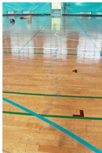
引きずりによるダメージ痕