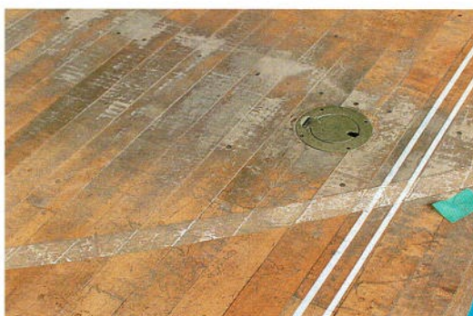
グラつきのあるボールアンカー器具と床