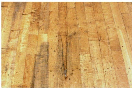
大きく裂けた床材