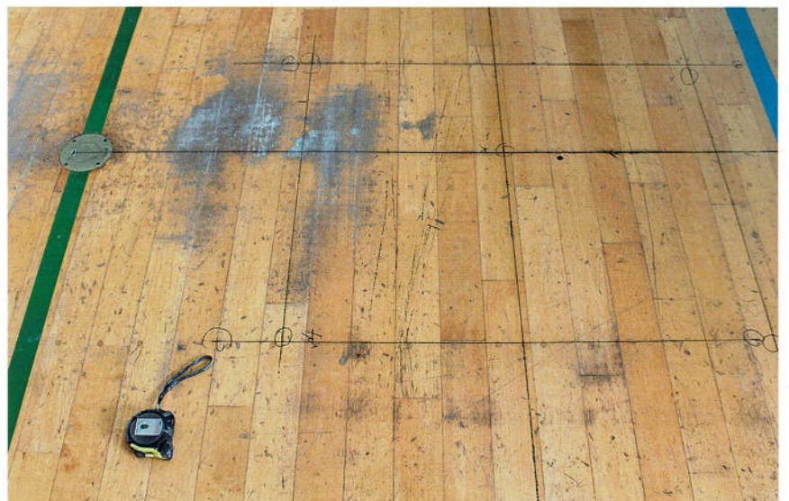
新規のボールアンカーの設置箇所の特定制量