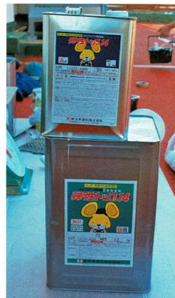
2 剤硬化型のライン塗装用 ウレタン弾性塗料