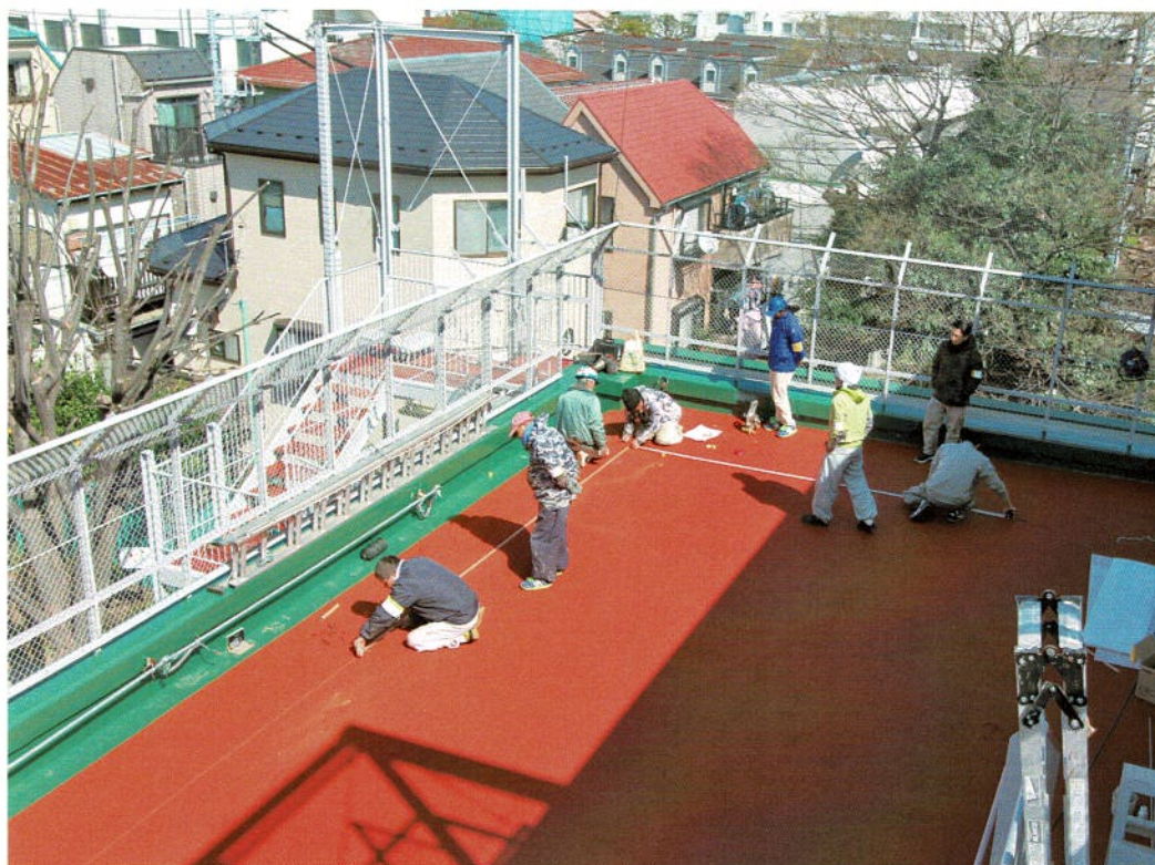
第2現場の施工開始