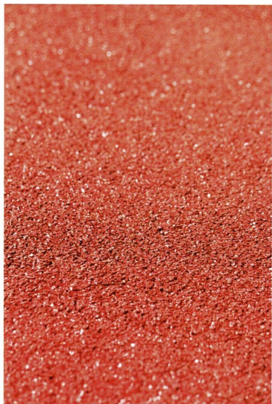
合成ゴム舗装材の競技用舗装面