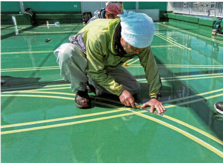
交差するマスキングテープの順位に合わせたセッティング作業