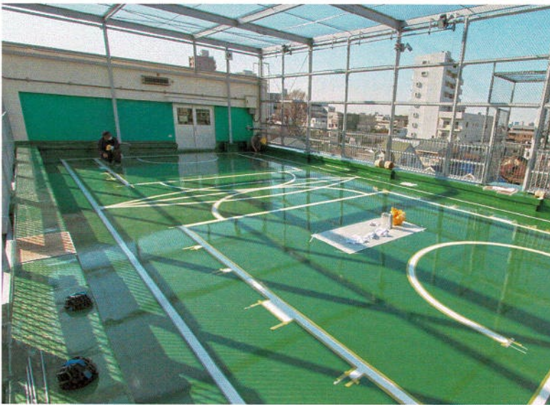
乾燥確認後、マスキングテープの剥離作業へ