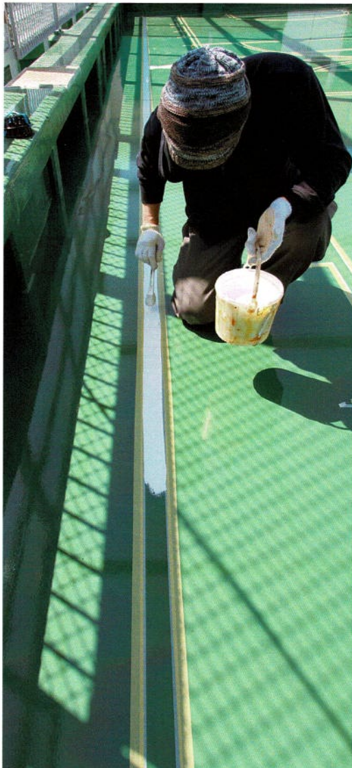
平行してライン塗装を開始