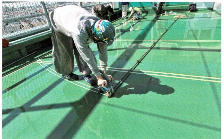
大口径サークルラインのマス킹作業