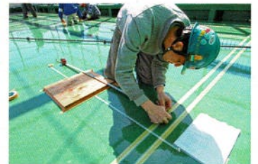
繰り返し精度のチェック