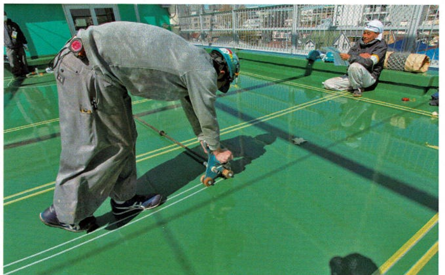
同 大口径サークルラインのマス킹作業