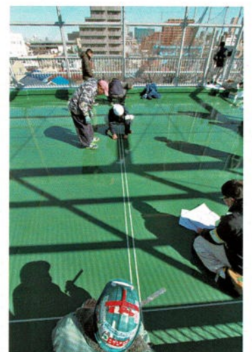
中心点から再確認