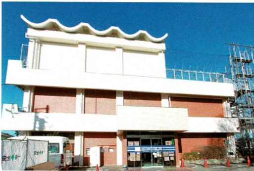
この建築物の屋上が施工場所です