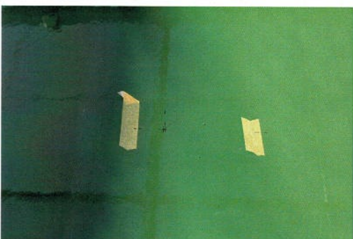
第1現場の施工基準の中心マーク確認