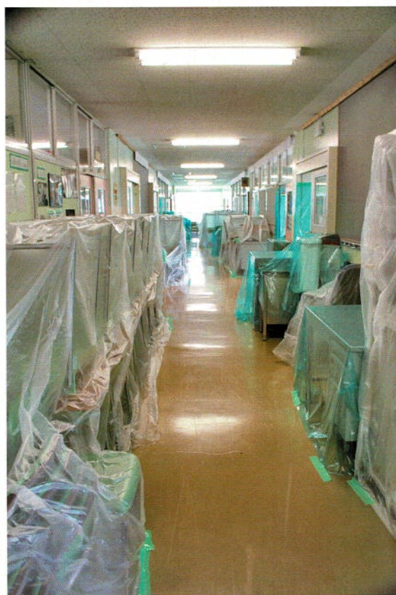
廊下に積み出された机なども丁寧に養生