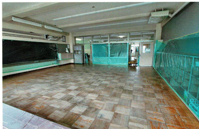
作業開始前に全体を養生テープング